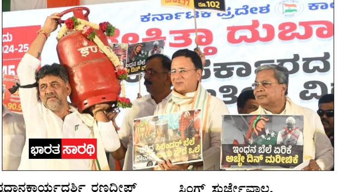
ಪ್ರಧಾನಕಾರ್ಯದರ್ಶಿ ರಣದೀಪ್ ಸಿಂಗ್ ಸುಜೇವಾಲ,

ಬೆಂಗಳೂರು: ಕೇಂದ್ರ ಸರ್ಕಾರದ ನೀತಿಗಳಿಂದ ದೇಶದಲ್ಲಿ ಜೀವನಾವಶ್ಯಕ ವಸ್ತುಗಳ ಬೆಲೆ ದುಬಾರಿಯಾಗಿದ್ದು, ಬೆಲೆ ಏರಿಕೆಗೆ ಮೋದಿ ಸರ್ಕಾರವೇ ಕಾರಣ ಎಂದು ಆರೋಪಿಸಿ ಕಾಂಗ್ರೆಸ್ ಇಂದು ನಗರದ ಪೀಠಂಪಾರ್ಕ್‌ನಲ್ಲಿ ರಾಜ್ಯಮಟ್ಟದ ಬೃಹತ್ ಪ್ರತಿಭಟನೆ ನಡೆಸಿದೆ. ಮುಖ್ಯಮಂತ್ರಿ ಸಿದ್ದರಾಮಯ್ಯ, ಕೆಪಿಸಿಸಿ ಅಧ್ಯಕ್ಷ ಹಾಗೂ ಉಪಮುಖ್ಯಮಂತ್ರಿ ಡಿ.ಕೆ.ಶಿವಕುಮಾರ್, ಎಬಿಸಿ